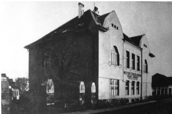
Obr. 1. Budova bývalého mestského hostinca využívaná ako gymnázium. Zdroj: Zbierky Tríbečského múzea v Topoľčanoch.