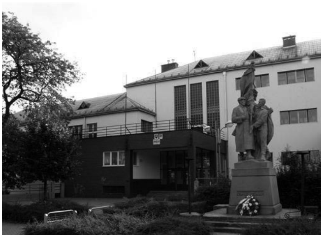
Obr. 5. Gymnázium dnes.