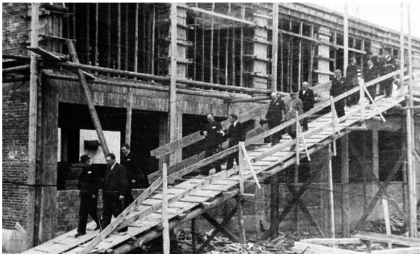
Obr. 4. Výstavba (mestské zastupiteľstvo prezerá prebiehajúcu prácu).